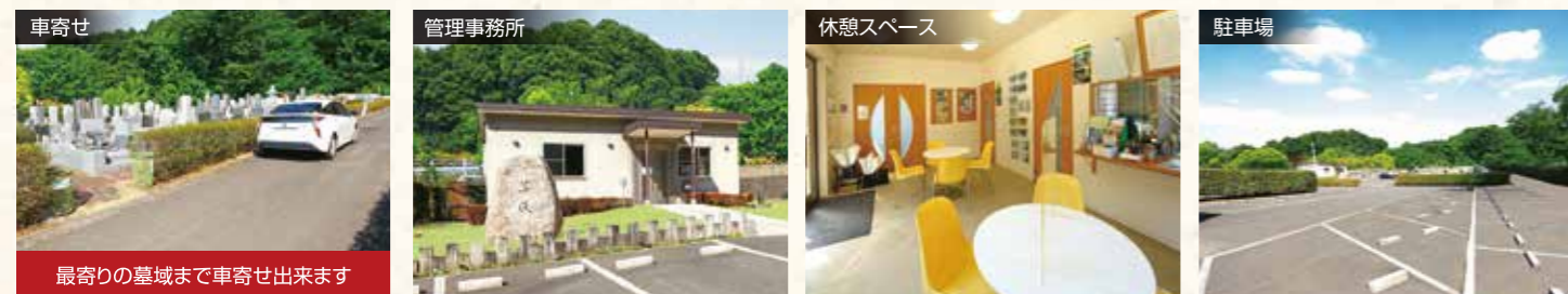
最寄りの墓域まで車寄せ出来ます